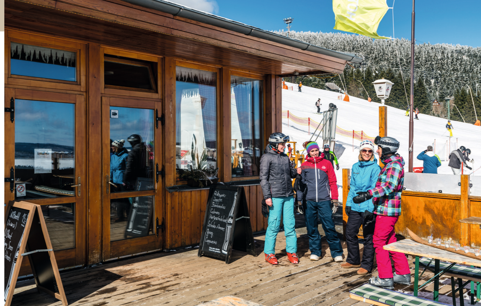
► Sonnenterrasse der Eventlocation Berghütte „Pistenblick“ direkt am Hotel, auch exklusiv mietbar